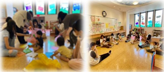
「つながろう1才のわ！」の様子

こども館の活動室って知ってますか？利用した事がある方も、まだ知らないという方も、たまごのスタッフと一緒に遊びに行きましょう！当日は10時からスタッフが活動室でお待ちしています。